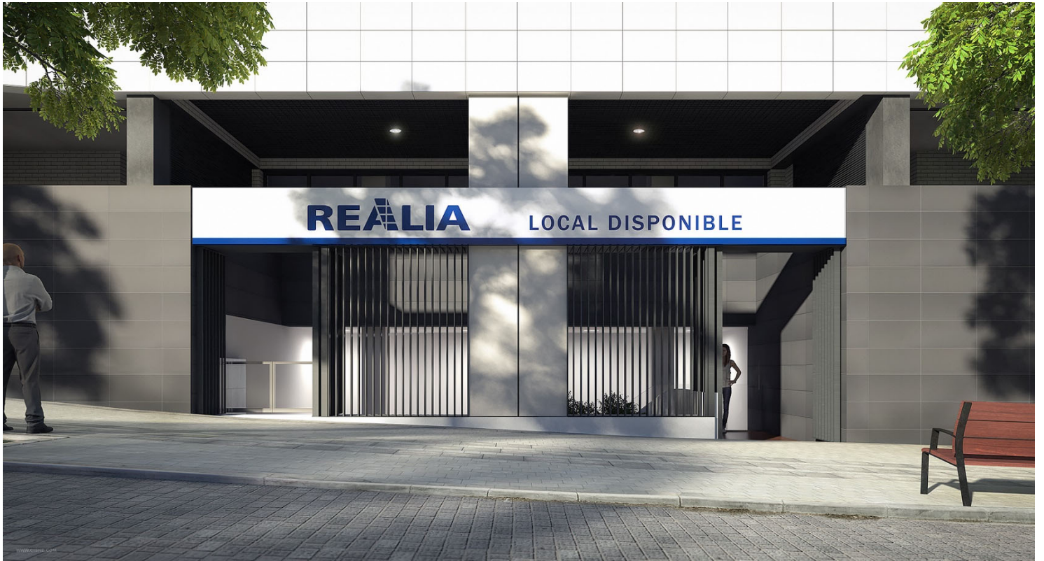
Simulación. Cierre de fachada