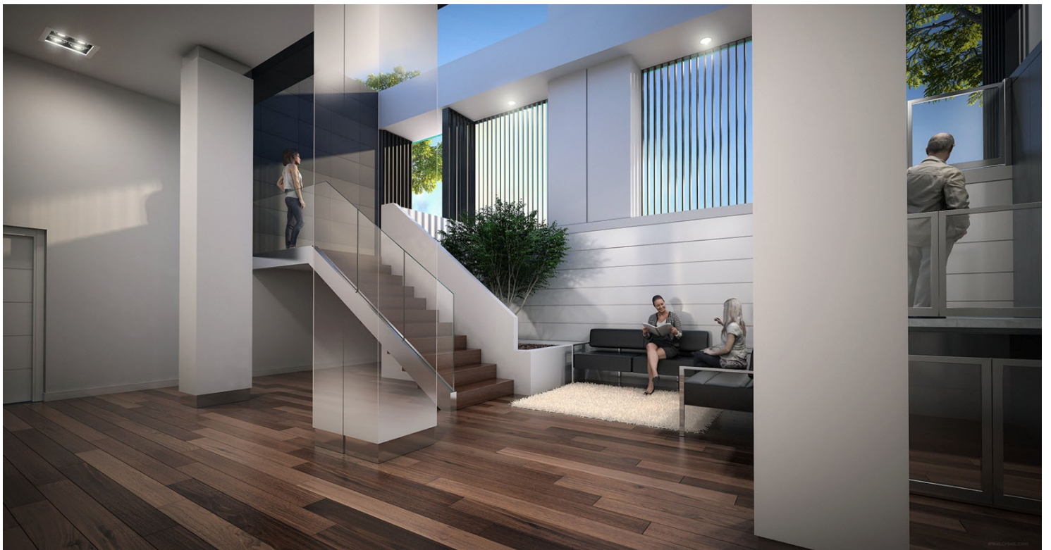
Simulación. Acceso a locales, con una superficie de 67,68 m 2 adicional a la superficie construida del local